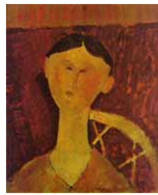
Agnetas bild mellan Modiglianis bilder där stolen är halv

Detta var något av de punkter jag pratade om innan de började arbeta