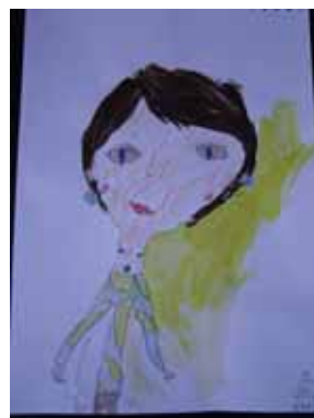
Självporträtt och självporträtt + 25 år